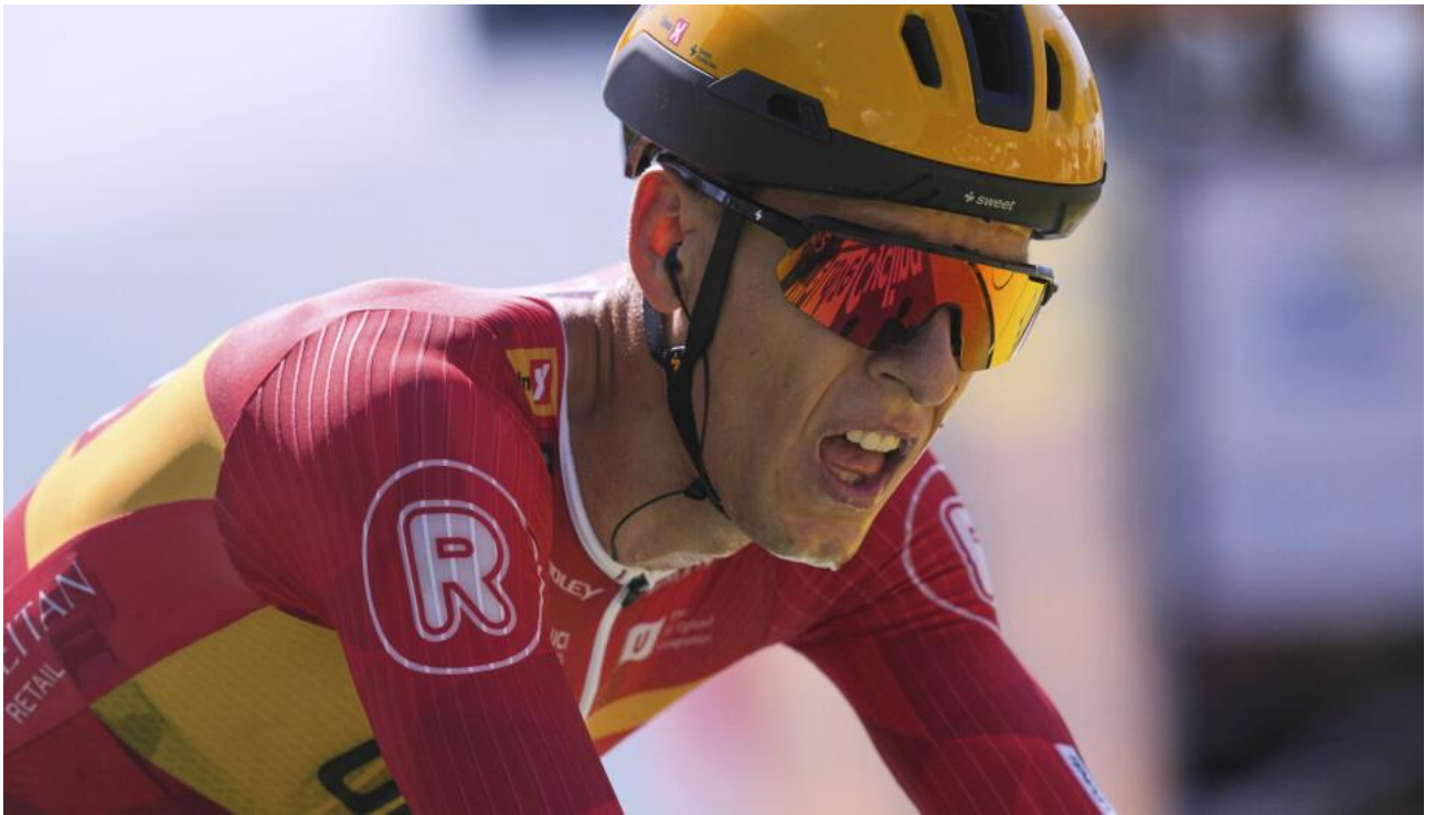
Tobias Halland Johannessen Foto arkiv.