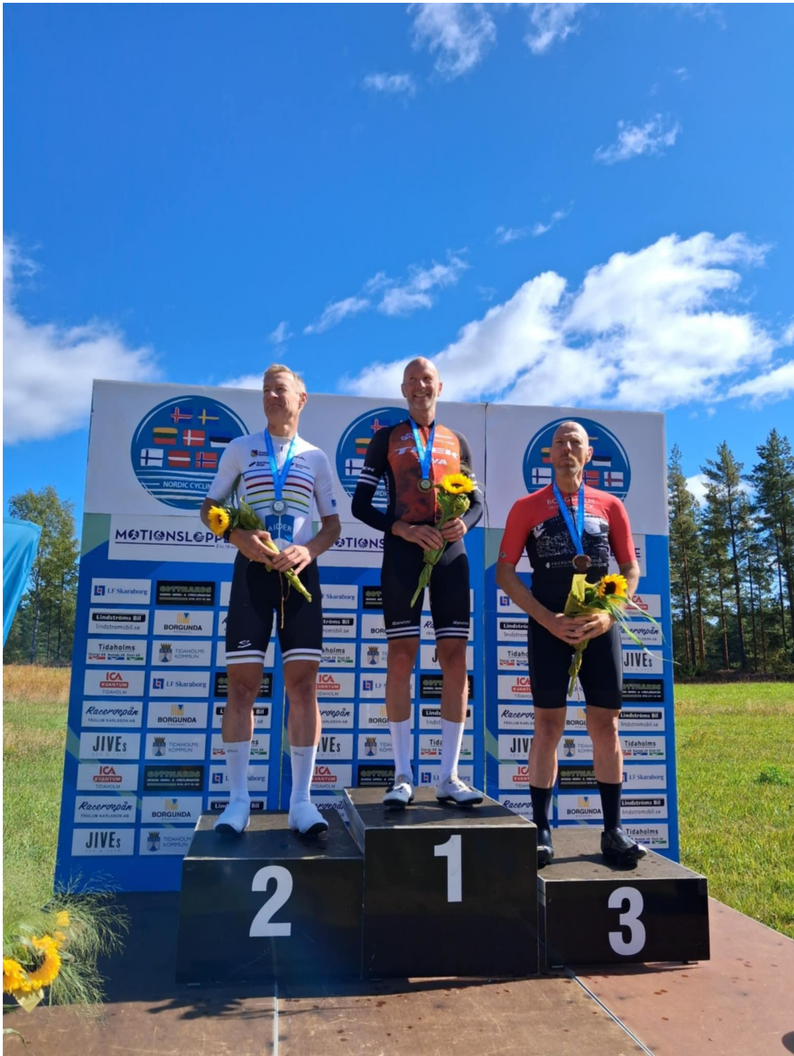
Fra Nordisk i Sverige 2025