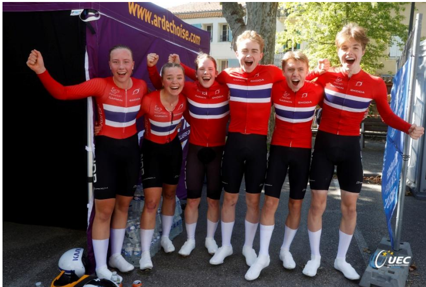
EM gull i Mixed Relay