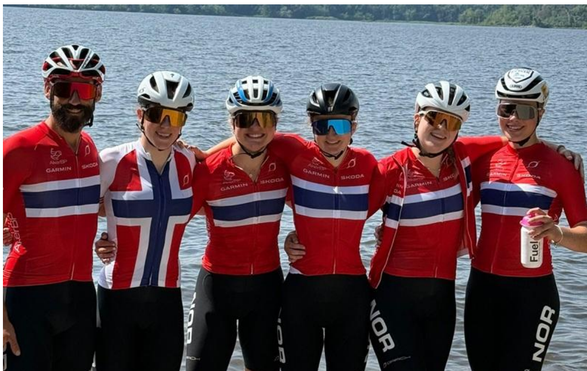
Kvinner junior på tur