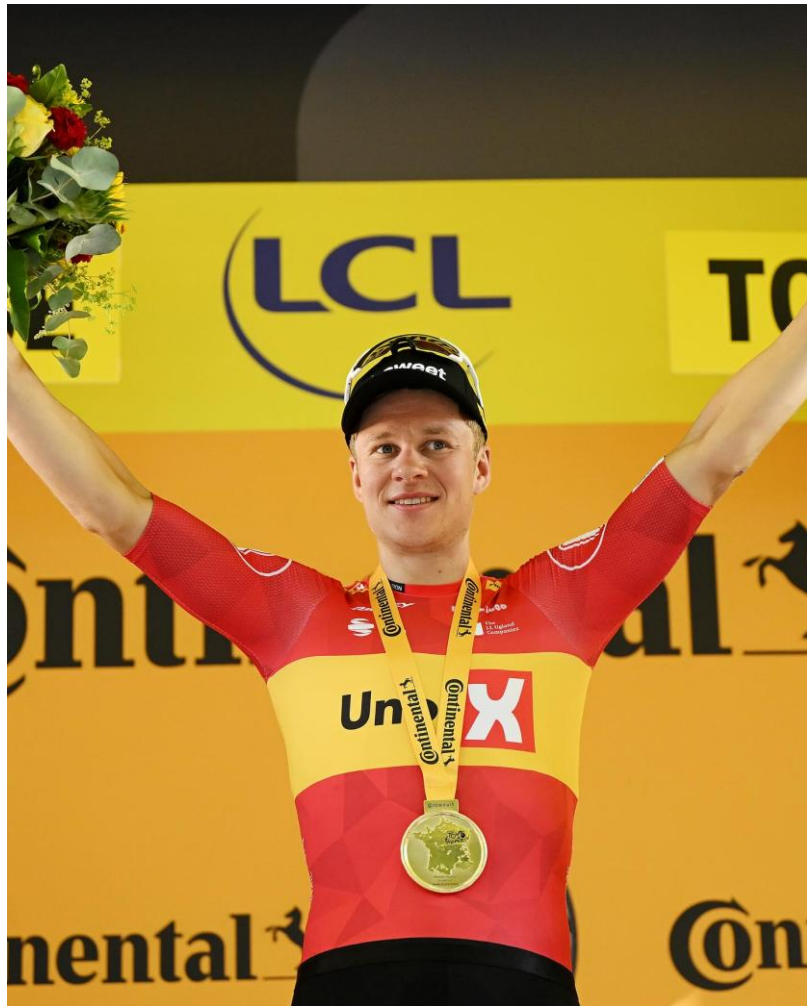
Jonas Abrahamsen i Tour de France 2025