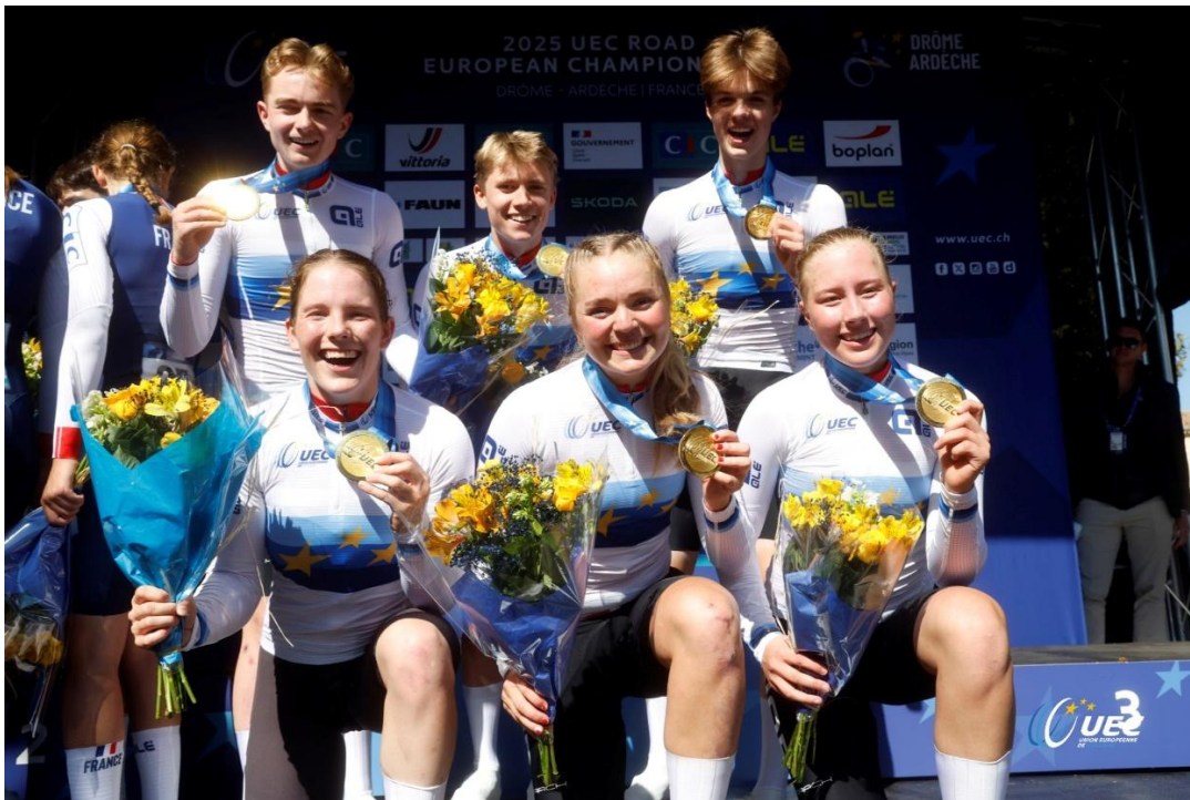
EM – junior Mixed Relay – Gull!