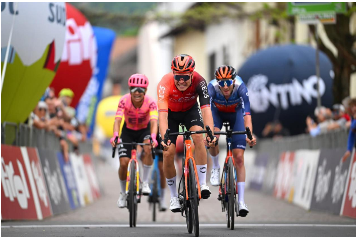
Tobias Foss i Tour of the Alps 2024