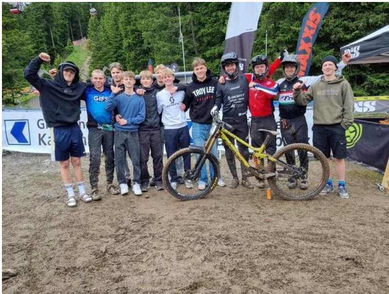
Bra norsk deltakelse under Europacup i Lenzerheide, Sveits.

Samtidig registreres positiv deltakelse i internasjonale ritt og mesterskap, samt gode miljøer rundt utøverne.