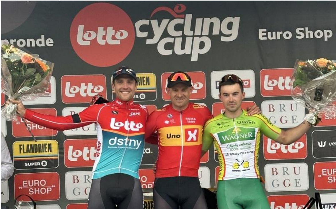
Alexander Kristoff i Elfenstedenronde Brugge i 2024