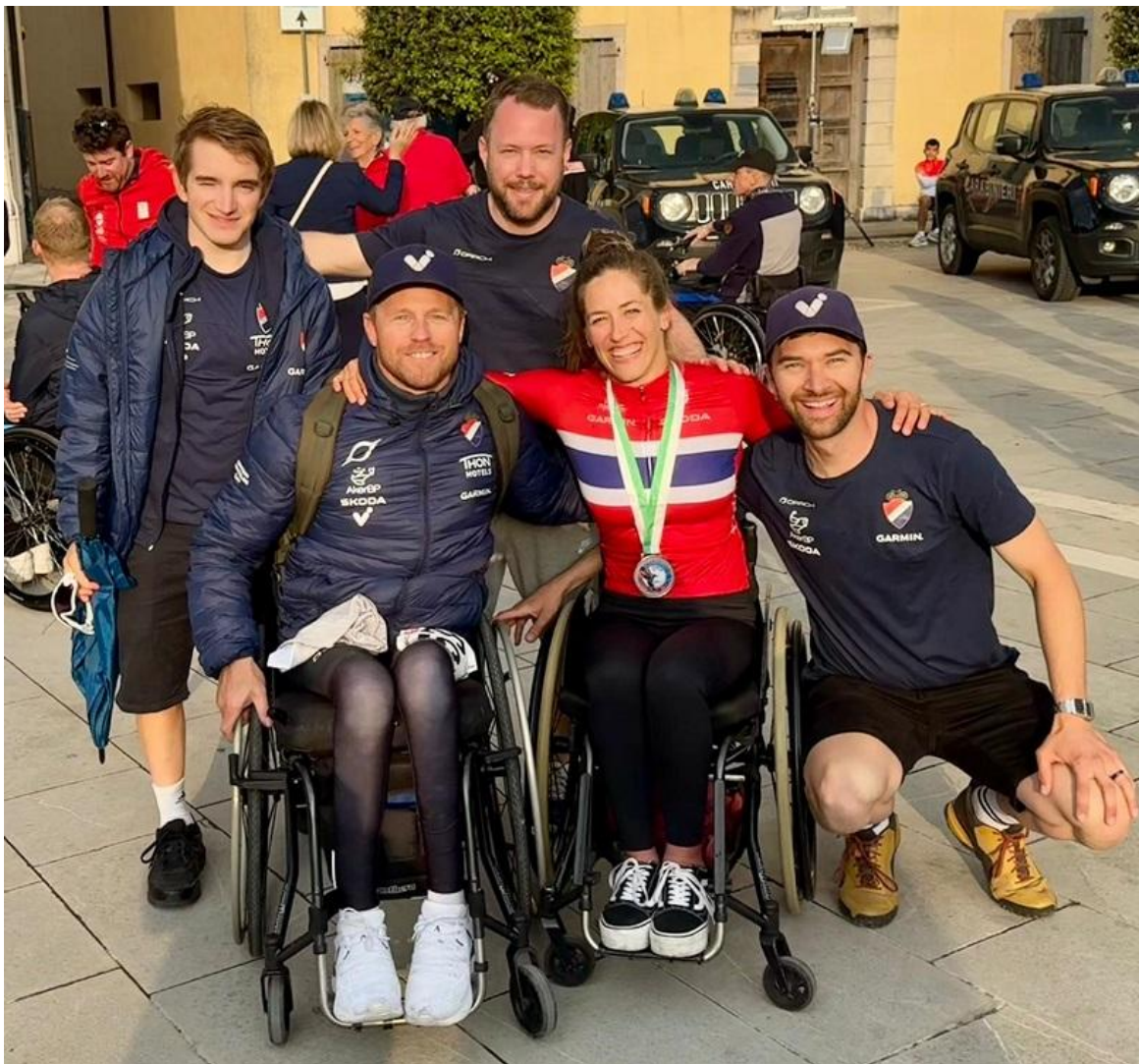
Landslag og støtteapparat i Parasykling

Leder for Parasykling og Banestrategi – Head of Paracycling and Track Strategy