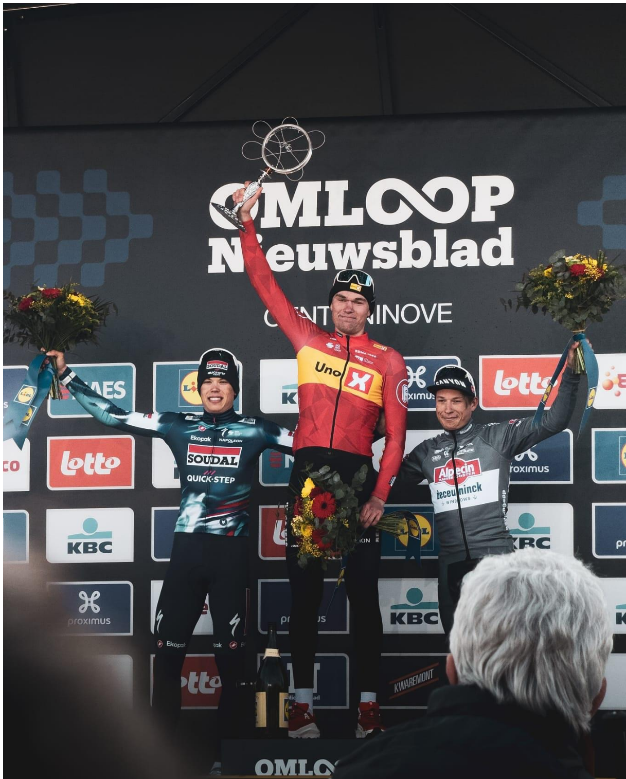
Søren Wærenskjold i 2025