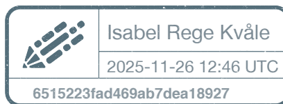
Isabel Rege Kvåle