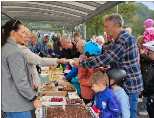
På åpningen av sykkelbanen på Moi, ble det også servert flere herlige kaker, både til små og store.