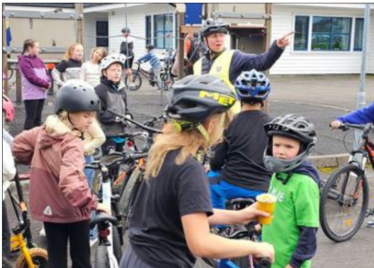
Ungene på Moi var heldige, som fikk sykle sammen med olympisk mester Gunn-Rita Dahle. For tjuve år siden ble hun olympisk mester i terrengsykling.