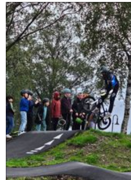
Utøvere fra Sviland BMX viste flotte sykkelkunstner på den nye sykkelbanen på Moi.